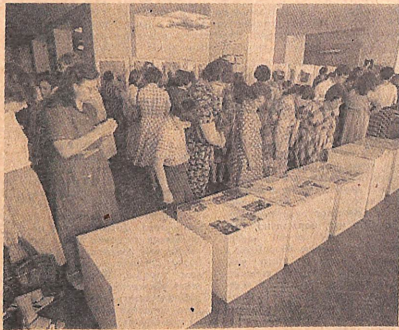
Дворец культуры «Октябрь». Книголюбів на выставке, посвященной 10-летию клуба «Олимп».